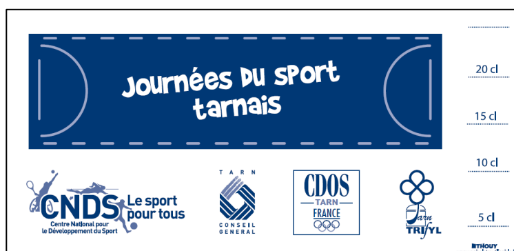
Visuel du gobelet qui sera utilisé lors de la manifestation

La buvette, proposée sur le site de Nabeillou par l'association des Archers du Dadou, servira les boissons dans ces gobelets.