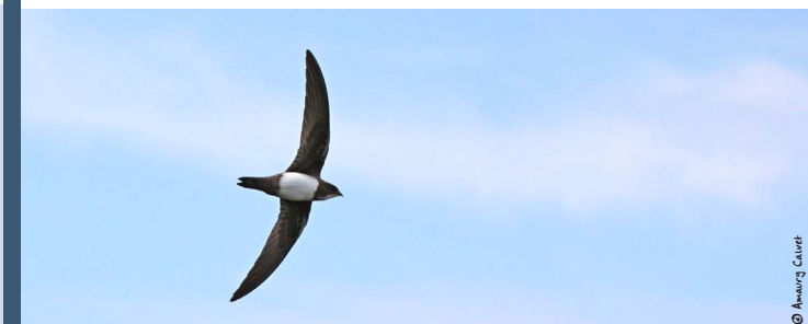
Martinet à ventre blanc

D'autres espèces d'oiseaux fréquentent aussi les falaises et peuvent être sensibles aux dérangements. Ici, il s'agit notamment du Martinet à ventre blanc, de l'Hirondelle de rochers et du Grand Corbeau.