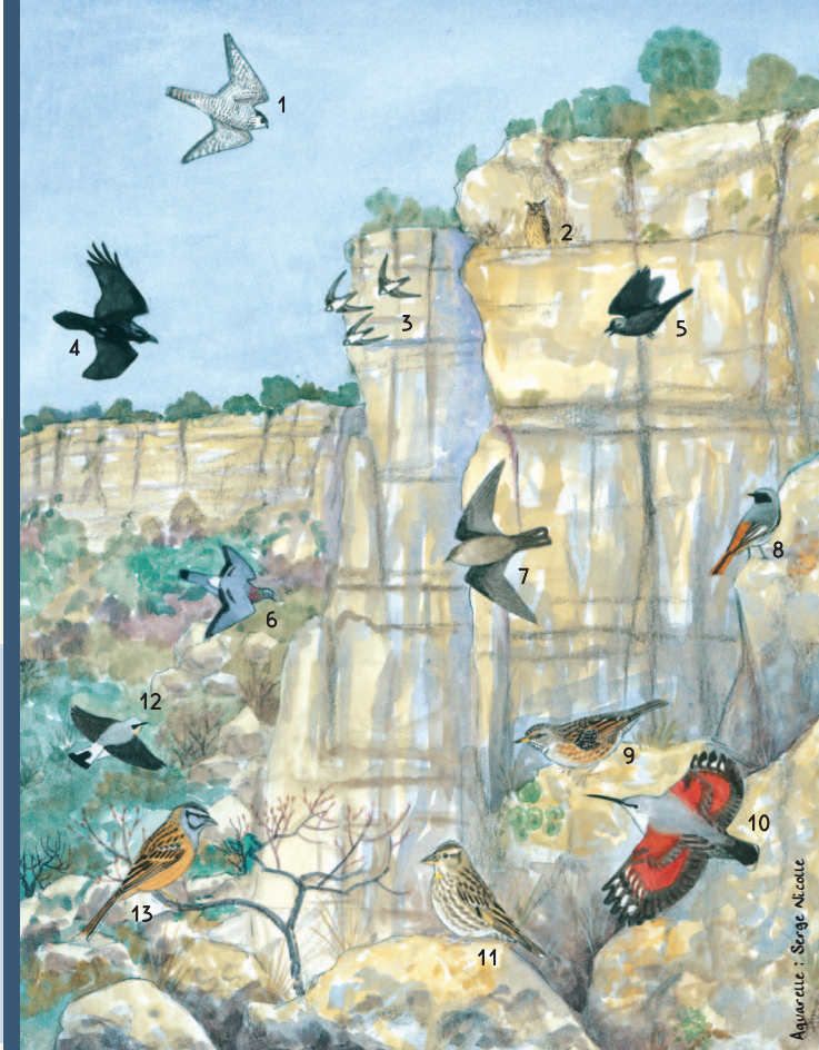
1 • Faucon pèlerin - 2 • Hibou grand-duc - 3 • Martinet à ventre blanc 4 • Grand corbeau - 5 • Choucas des tours - 6 • Pigeon colombin - 7 • Hirondelle des rochers - 8 • Rouge-queue noir - 9 • Accenteur alpin - 10 • Tichodrome échelette 11 • Moineau souldie - 12 • Traquet motteux - 13 • Bruant fou

D'autres espèces d'oiseaux fréquentent aussi les falaises et peuvent être sensibles aux dérangements. Ici, il s'agit notamment du Martinet à ventre blanc, de l'Hirondelle de rochers et du Grand Corbeau.